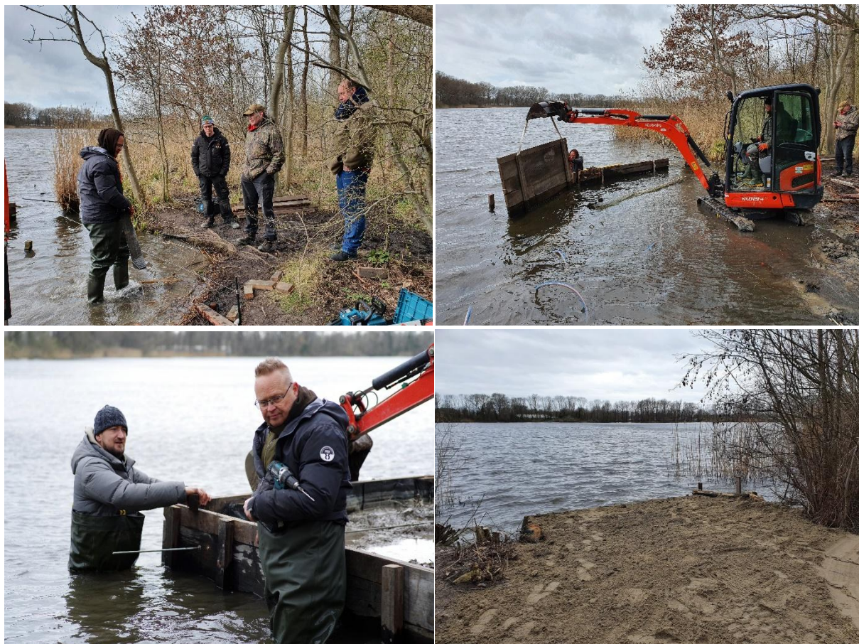
De sfeer en saamhorigheid was weer top tijdens het klusweekend.

Drie stekken (1, 5 en 13) zijn groots onderhanden genomen met hardhouten schoeiingen. Bij de stekken zijn overhangende takkenbossen aangepakt en er zijn bomen uit het water getrokken die daar stormen waren ingevallen. Het recreatieschap gaat nog wat zand aanvullen en we krijgen boomstammen om de stekken die erg open zijn af te schermen.